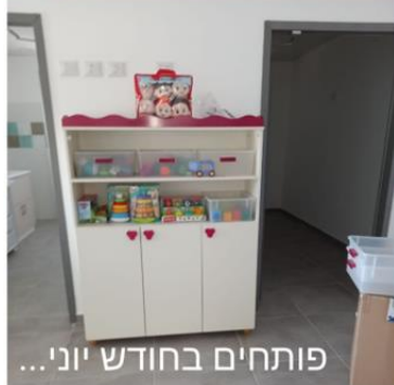
פותחים בחודש יוני...