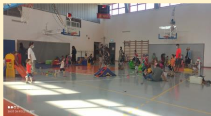
משחקייה באולם ספורט השבוע

יום רביעי, י"ט אב, 28.7, בשעה 17:00: שעת סיפור בספריה עם מיה סהר