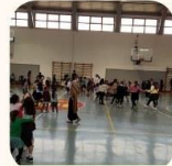
הרקדה לכבוד פורים קטן