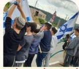
מלואים את החיל מצוה מורל הייד בדרום האחרונה

• ביום שלישי התקיים ערב עם הרב שלמה שוב להורי כיתות ה'ו' בנים בנושא התבררות. תודה להורים שבאו - כולנו נתרמנו ממפגש משמעותי וחשוב להמשך התקשורת עם בנינו.