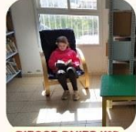
זמן קריאה בספריה

• ביום שלישי התקיים ערב עם הרב שלמה שוב להורי כיתות ה'ו' בנים בנושא התבררות. תודה להורים שבאו - כולנו נתרמנו ממפגש משמעותי וחשוב להמשך התקשורת עם בנינו.