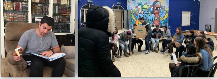
שבט ניצנים בנות במסע פסח