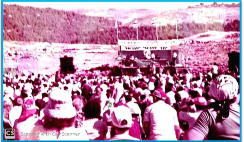
טקס הנחת אבן הפינה של היישוב