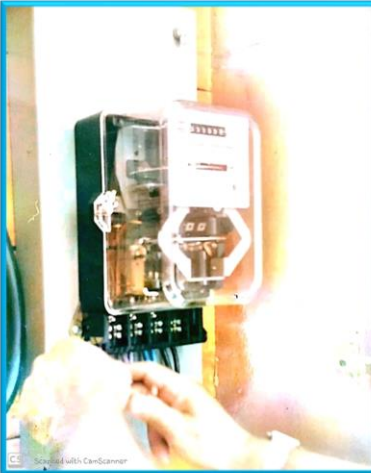
חיבור לחשמל לאחר חודשיים ללא חשמל