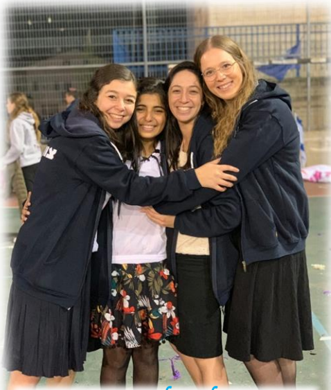
ארבעת המופלאות לאחר חודש ארגון..

ולנו נוצר יקר- שנזכור תמיד את הצוצמות של החבורה הדדולה שלנו. שנמשיק לחלום, ליצוט ולהשטיט, בצורה הטובה ביותר! ❤️