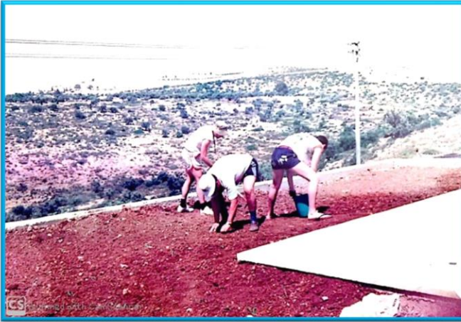
דוד איזמן ובניו שותלים דשא בביתם