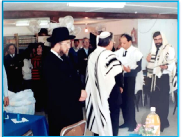
ברית מילה ברב תכליתי. חודש שבט, התשנ"א