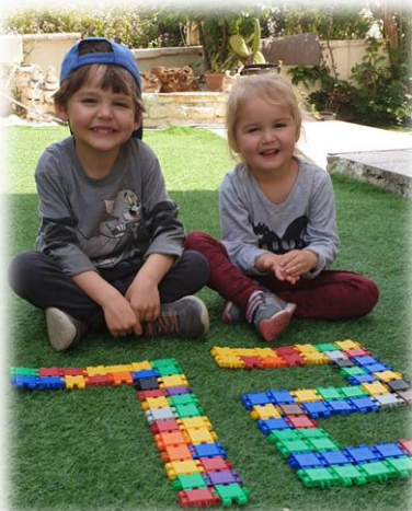
יהאץ וגוריה שרון