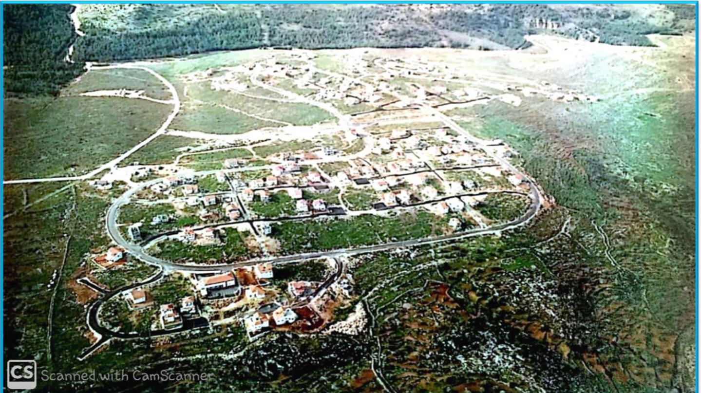
תמונת היישוב בימיו הראשונים ממעוף הציפור