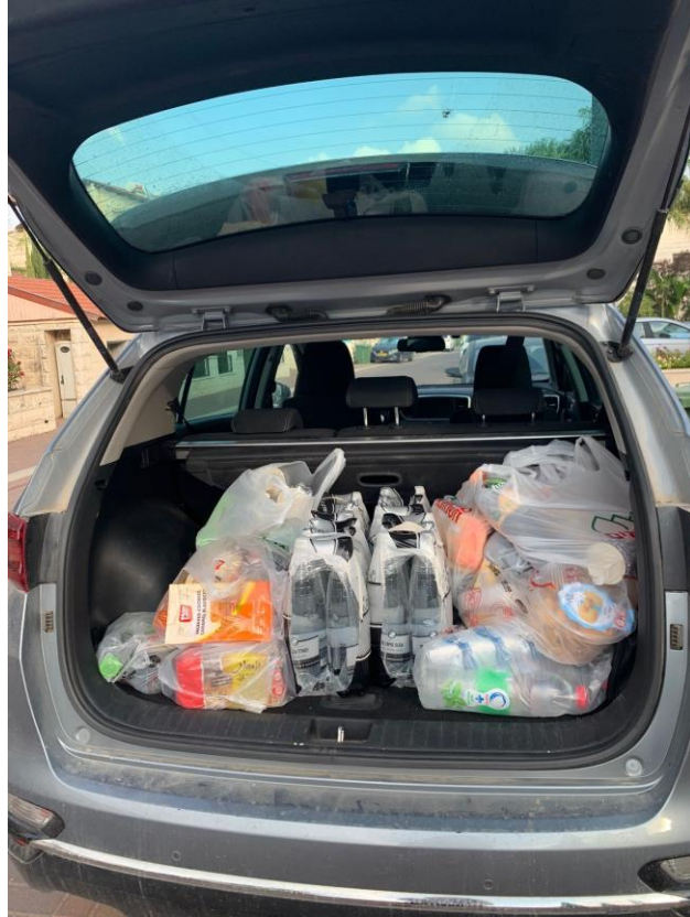
ישר כח לכל התושבים שאוספים ציוד מזון ופינוקים ומעבירים לחיילים תודה לכל המשפחות התורמות - 6