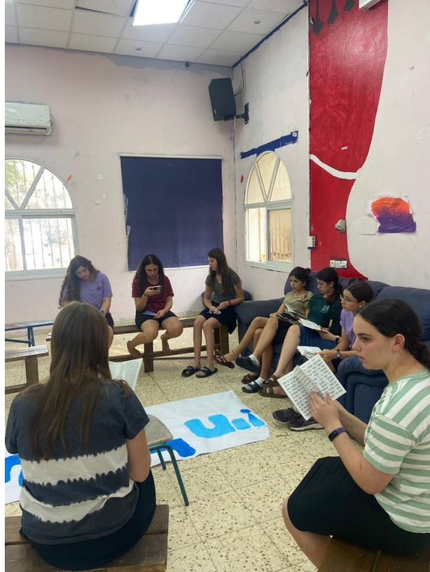
קריאת תהילים - 3