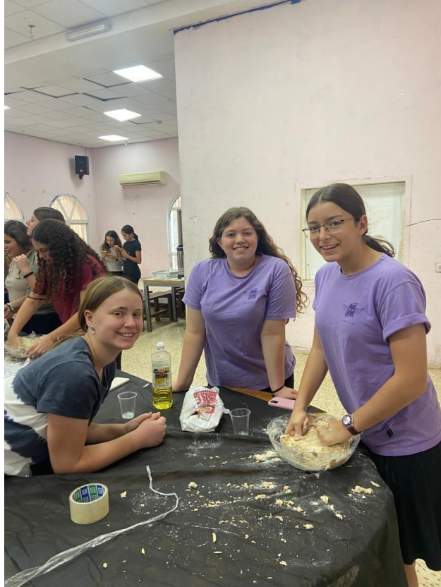
הפרשת חלה - 2