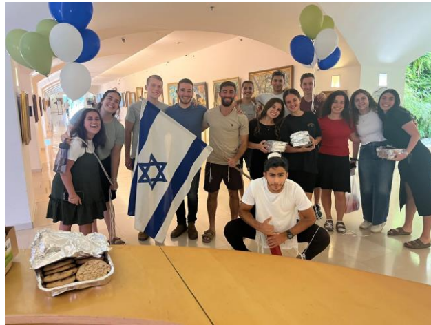
!שבט סיני יצא לבית חולים ביילינסון לשמח חיילים פצועים - 1