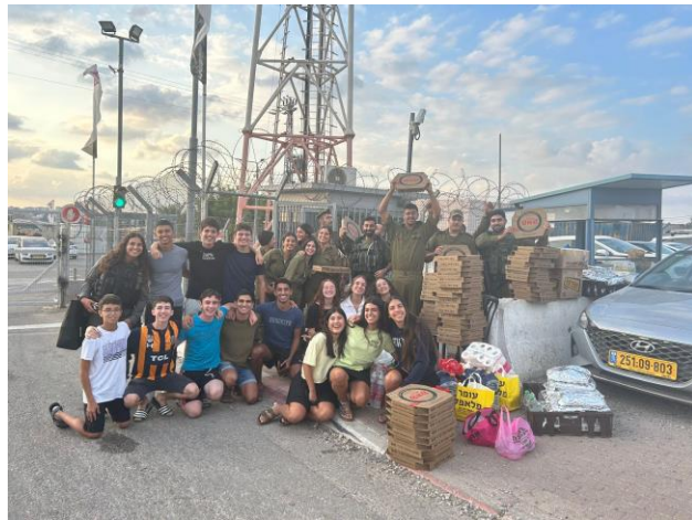
צוות הדרכה של חשמונאים יצאו לחיילים במכבים 🇮🇱 והביאו להם יותר מ-70 מגשי פיצה ומנות פאלפל - 7