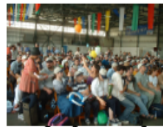
קבלת פנים לצולאים בשדה התצופה - "כפ כפס"