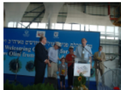
אקבלים תצורת הלהות בשדה התצופה

אנו מברכים את התושבים החדשים ומאחלים להם קליטה נעימה ומהירה ביישובנו.