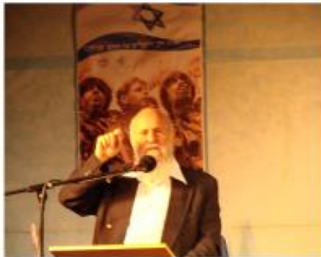
"אם היו נותנים לי לבחור מתי להיוולד, הייתי בוחר את התקופה הנוכחית"- הרב יוסי שריד