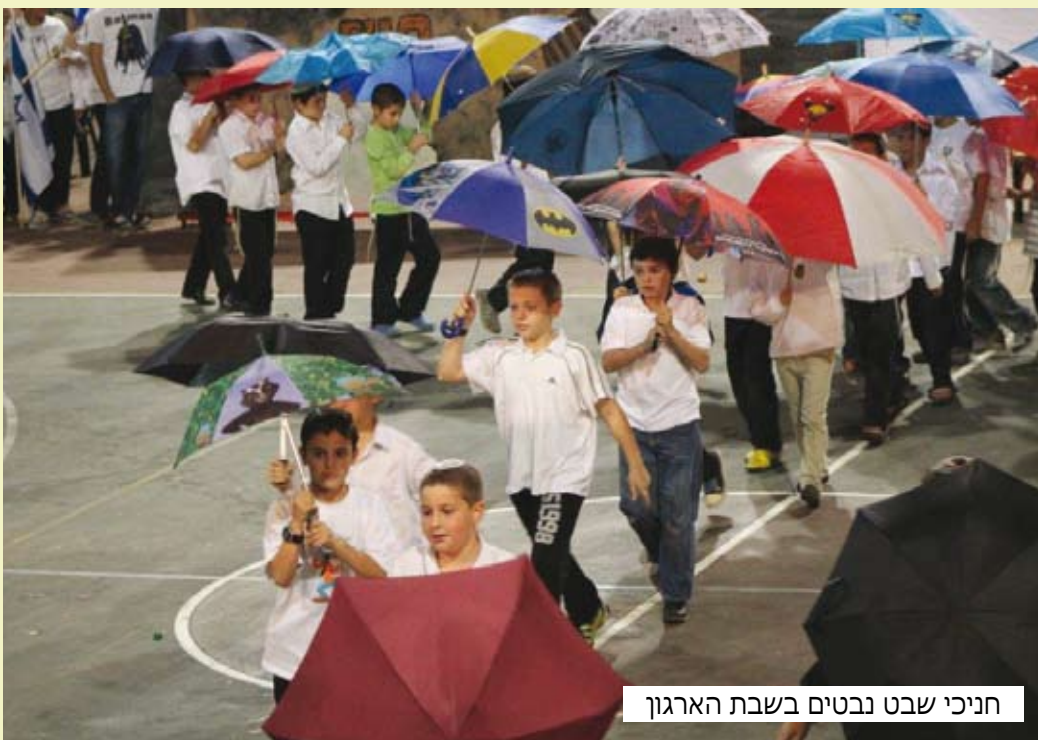
חניכי שבט נבטים בשבת הארגון

מתן מענה מתאים לחתך רחב ככל האפשר של האוכלוסייה מגילאי 55 ומעלה בתחומי תרבות, העשרה מקצועית, מערך התנדבויות ומעגלי תמיכה קהילתיים. מטרת העמותה היא לאפשר לאוכלוסייה הבוגרת להישאר לגור בבתיהם שביישובים עד 120 בחיים מלאים ומכובדים. העמותה פועלת בתמיכתם ובעידודם של מועצות בנימין ובית אל. המקצועות הנקציבים, תשתית ארגונית וליווי מקצועי של עובדות סוציאליות קהילתיות. בניית מערך פעילות העמותה נעשית בשיתוף פעולה עם מחלקות הרווחה תוך יצירת מקסימום שיתוף עם הקהילות ביישובים. כמו כן העמותה מתקצבת סכום מסוים לפעילות הותיקים ביישוב וזאת תמורת שקל מול שקל.