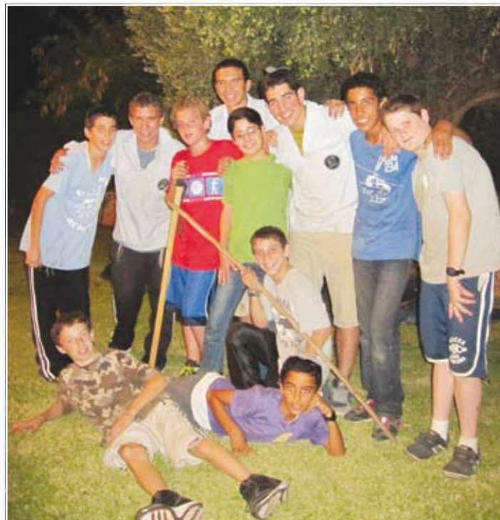
חניכי שבט מעלות בתום המסיק

כל כיתה צפתה בסרט העוסק בנושא זה"ב וממחיש את כליי החצייה הבטוחה וכללי נסיעה ברכב. לאחר הסרט, השתתפה כל כיתה בחידון בנושא. לכיתות גד הכנו משחק טרוויה, וכיתות ה'ז נהנו מחידון "אמת ושקר". אחר כך יצרו התלמידים יצירות הקשורות לנושא: כיתות א' הכינו שעויות לשולחן, כיתות ב'ג הכינו את תפילת הדרך למכונית. כיתות ד'ה סימנויות של מעבר חצייה. כיתות ה'ז יצרו בולים בנושא זה"ב. כל ילד הכין לעצמו מדליה שבה התחייב לשמור על הכללים.