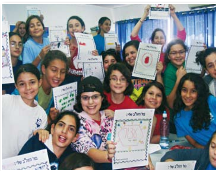
בנות כיתה ו' עם בולי זה"ב שעיצבו