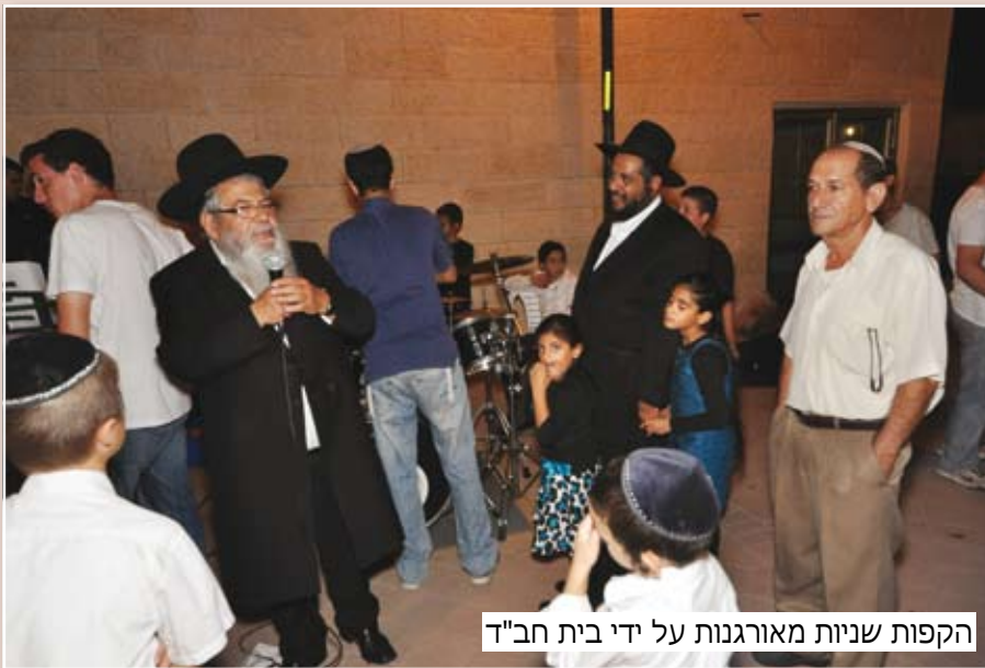
הקפות שניות מאורגנות על ידי בית חב"ד

קניות שילת לזכותם במצוות הדלקת נרות חנוכה.