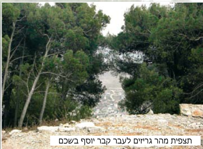
תצפית מהר גריזים לעבר קבר יוסף בשכם

קבלנו מחזקי בצלאל שהוא מלך הארץ ולו ההלל!