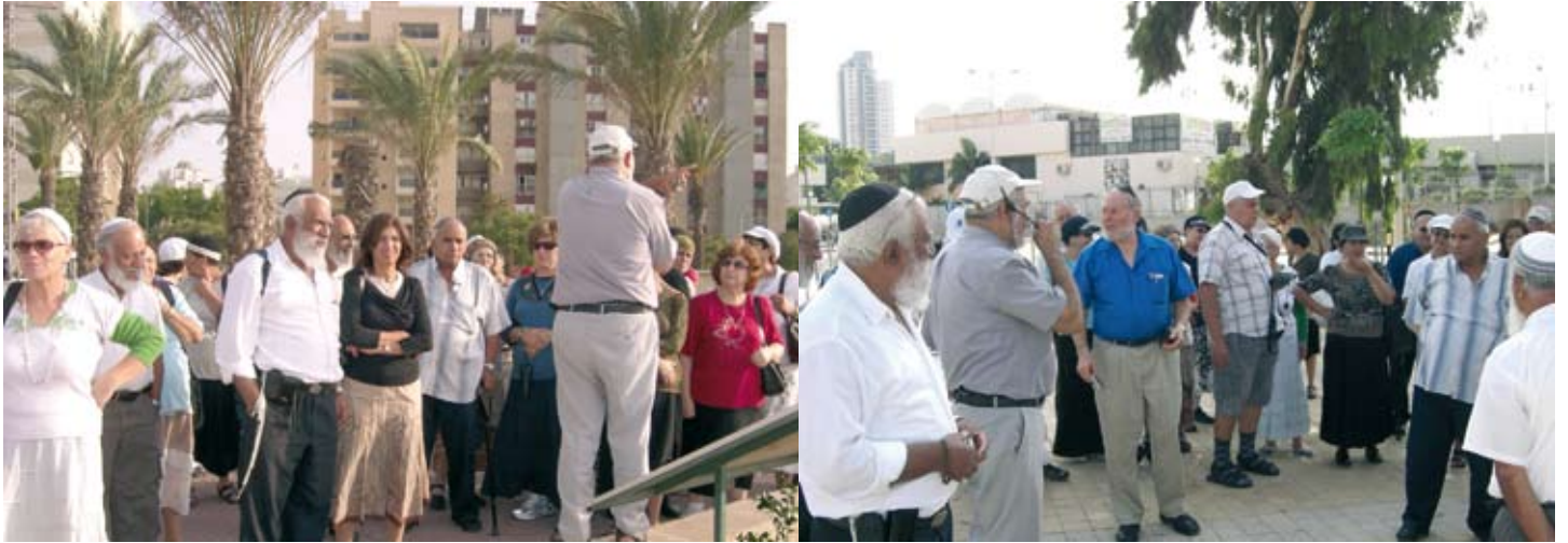
מטיילים בראשון לציון