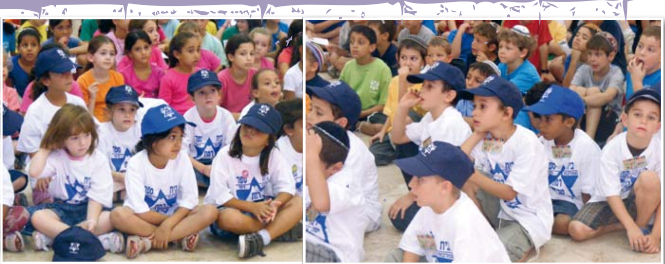
תלמידים בעת פתיחת בית הספר