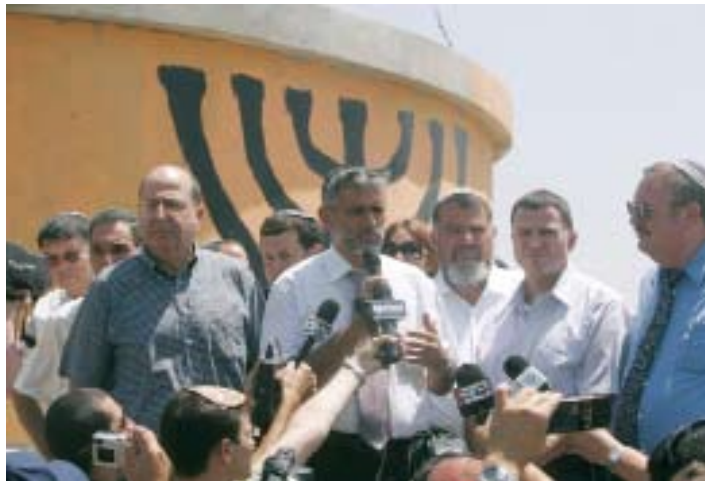
שרי ממשלת ישראל בביקור בחומש

קרקעות המדינה (למשל בג"ץ קציר ועוד) פסק כי אדמות המדינה וק"ל אינם שייכות לעם היהודי אלא לכלל אזרחי המדינה מוסלמים/נוצרים/דרוזים/בדואים וגם ליהודים. כיצד אנו מתמודדים נכונה ומובילים מהלך המוביל עם ישראל לעמידה יהודית איתנה בכל ארץ ישראל. כמובן שיריעה זו קצרה מלסכם את דברי הרבנים, אנב נשמח לשלוח סיכום של הערב לכל המעוניינים באמצעות המייל.