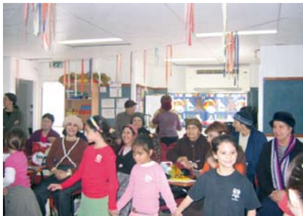
כיתה א' בית המפגשים