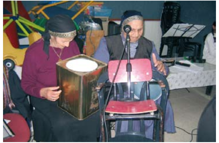
מסיבת חנוכה בית מפגשים