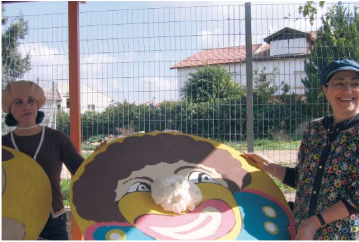
בית מפגשים נשים לקראת פורים