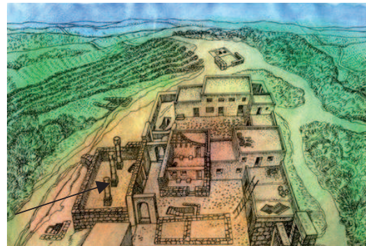
טניה קורנפלד: ציור של 'עתרה'. ביהכ"נ משמאל

בעמודים של שרידי המבנים במקום אפשר לראות חורים, שנועדו לנעילת השערים, וגם שקעים ששימשו