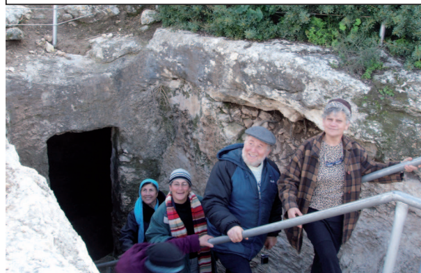
התקופה הפרסית ועד לראשית התקופה הביזנטית – כולמר; במשך 800 שנה ברציפות.