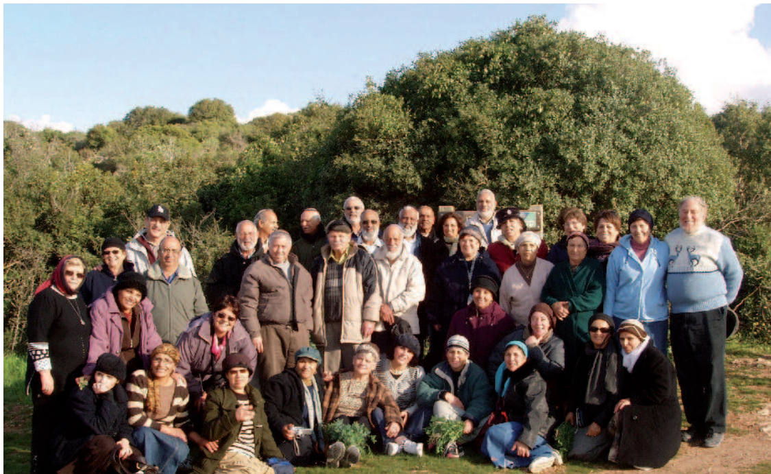
מטיילי חשמונאים – חוג 'מפגשים' – בתמונה קבוצתית בכניסה לחורבת עתרי