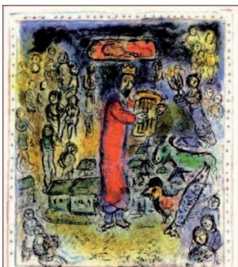
דוד המלך בעיירה/ צייר: מארק שגאל

בעז"ה, ביום שני, ח' באלול, תשס"ח (8/9/08) יתחדשו השיעורים בספר שמואל א'. השיעורים יתקיימו, אי"ה, כאשתקד, בימי שני, בין השעות 09:00 – 11:00 ב"מרכז הפיס" הישובי. הכניסה חופשית.