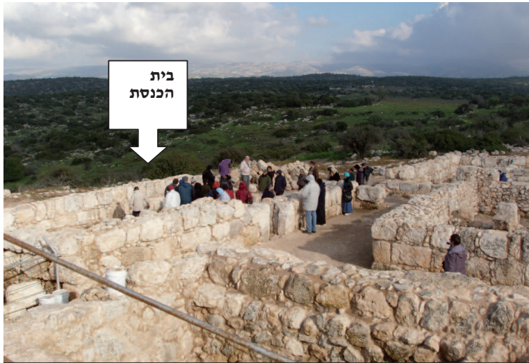
מטיילי חשמונאים – חוג 'מפגשים' – בבית הכנסת בחורבת עתרי

חשיפת חורבת עתרי טרם הושלמה, אך ממחקר האזורים שנחפרו ונחשפו, ניתן ללמוד רבות כיצד נראה כפר יהודי טיפוסי מתקופת הבית השני על מבניו, חצרותיו, מתקניו ומבני הציבור שהיו בו.