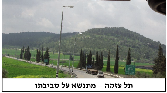
תל עזקה - מתנשא על סביבתו

בהיסטוריה . קרב זה התרחש בעמק האלה , סמוך לעזקה. ההיערכות למלחמה זו הכתוב מספר: "וַיֵּאָסְפוּ פְּלִשְׁתִּים אֶת מַחְנֵיהֶם לְמַלְחָמָה, וַיֵּאָסְפוּ שָׂכָה אֲשֶׁר לַיהוּדָה, וַיַּחֲנוּ בֵּין שׂוֹכָה וּבֵין עֲזָקָה בְּאַפְסֵי דָמִים." (שמואל א,יז,1).