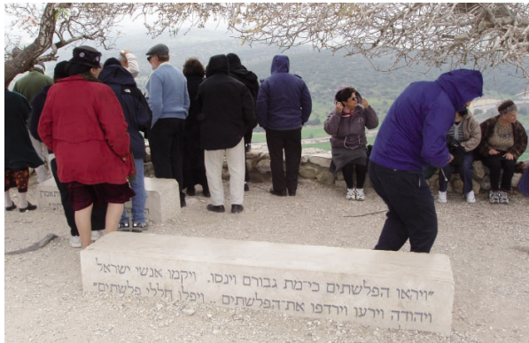
מטיילי חשמונאים- חוג 'מפגשים' על תל עזקה

תל עזקה הינו חלק מפארק בריטניה השוכן בליבה של שפלת יהודה, על פני גבעות עטורות ביערות נטועים ובחורשים טבעיים. הפארק