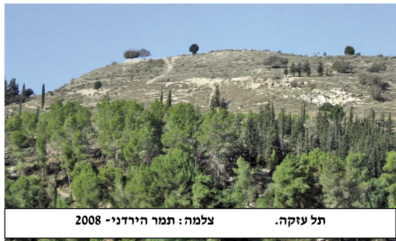
תל עזקה. צלמה: תמר הירדני - 2008

בי"ז בתמוז, יחלו שלושת השבועות של "בין המצרים", הידועים מקדמא דנא כימי פורענות לישראל.