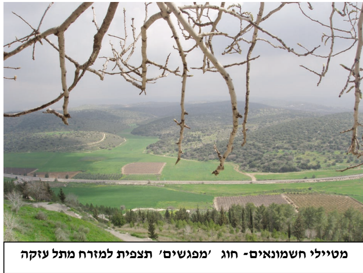
מטיילי חשמונאים - חוג 'מפגשים' תצפית למזרח מתל עזקה

מצאתי לנכון, ליחד כתבה זו לתל עזקה, אתר שעליו ובסביבתו היתה אחת מערי יהודה הידועות שהחורבן לא פסח עליה. עזקה - היתה עיר מבצר חשובה ביהודה ונכבשה ע"י מלך בבל. חורבנה בשר את חורבן ירושלים ואת גלות הבית הראשון - גלות בבל.