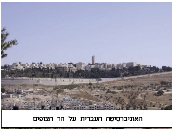
האוניברסיטה העברית על הר הצופים

בשנות הארבעים של המאה ה-20 היה הר הצופים בשיא פריחתו ושכנו בו האוניברסיטה העברית, שנוסדה בשנת 1925, ובית-החולים 'הדסה' שנוסד בשנת 1939. הדרך מירושלים העברית להר הצופים