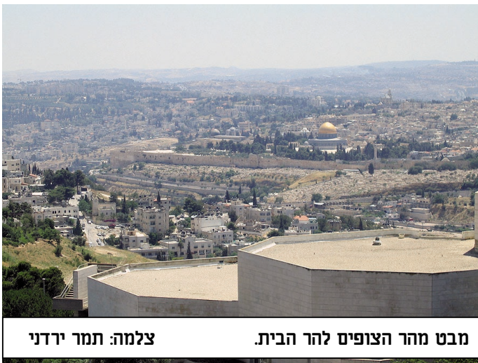
מבט מהר הצופים להר הבית.

ב-7 ביולי 1948, הושג הסכם עם בריגדיר לאש, המפקד של כוחות הלגיון